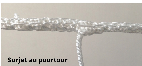
Surjeté au pourtour